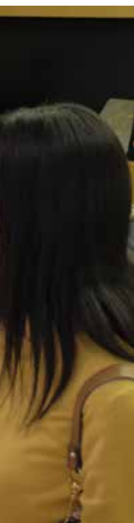
▲ Bei den Mardis littéraires sind die Zuschauerränge stets gut gefüllt.