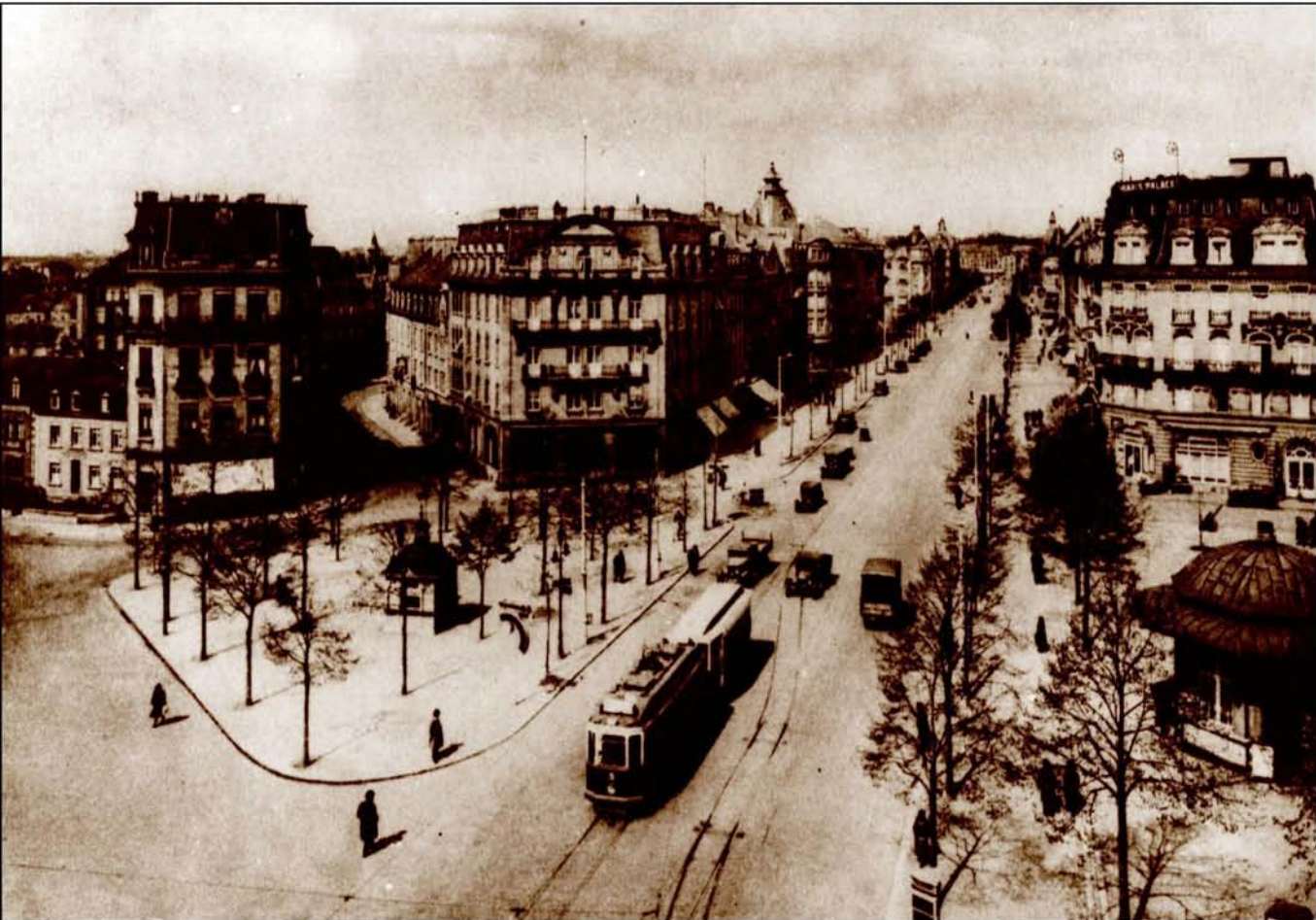
Le second bureau d'accueil du Syndicat d'Initiative et de Tourisme (S.I.T.) se situait au pavillon de la Place de Paris (1935)