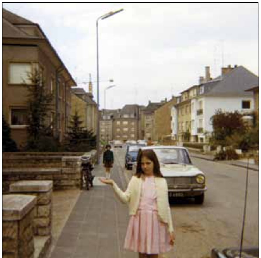
Kannerkonschte mam neie Fotoapparat. Am Hannergronn eng Simca 1301

D'Elteren, déi haten och genuch aner Saachen ze dinn. Di meescht Familien haten e puer Kanner, d'Mamme wore bal all Hausfraen. Wann d'Pappen heemkamen, huet missten Zopp an z'lesse prett stoen. Akaf gouf meeschtens nach an der Epicerie, um Maart oder am Beamte-Konsum beim Park. D'Kleeder fir d'Kanner selwer bitzen, Plouvere strécken, dat wor eng Selbstverständlechkeet. Wann et mol méi roueg wor, gouf vill tëscht Frëndinnen telefonéiert. Oder d'Mammen hu sech géigesäiteg d'Hoer coifféiert, da goug just Rieds vu Plix, Mise-en-pli oder Bigoudi. ▶