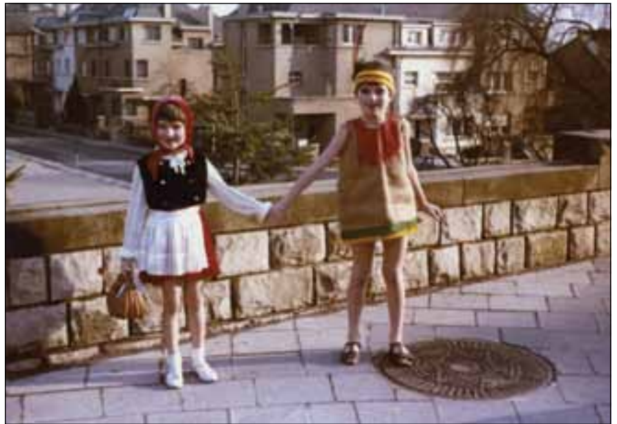
Fuesboken an der Kéier vun der Rue Charles Arendt. Riets geet et d'Trappchen erof bei de "Pärkelchen"

Am Summer hunn ech an där Wiss alt emol e Schatz verstoppt: eng Kartongskëscht, déi ech mat Spillsaachen a Séissegkeeten vollgepaak hat. Wéi ech iergendwann nees duerno siche gaang sinn, wor ech entgeeschtert, datt dee schéine Schatz sech a seng Bestanddeeler opgeléist hat, iwwreg wor just nach e Koup fichte Kartroug, an dertëscht verraschtene Kréppéng.