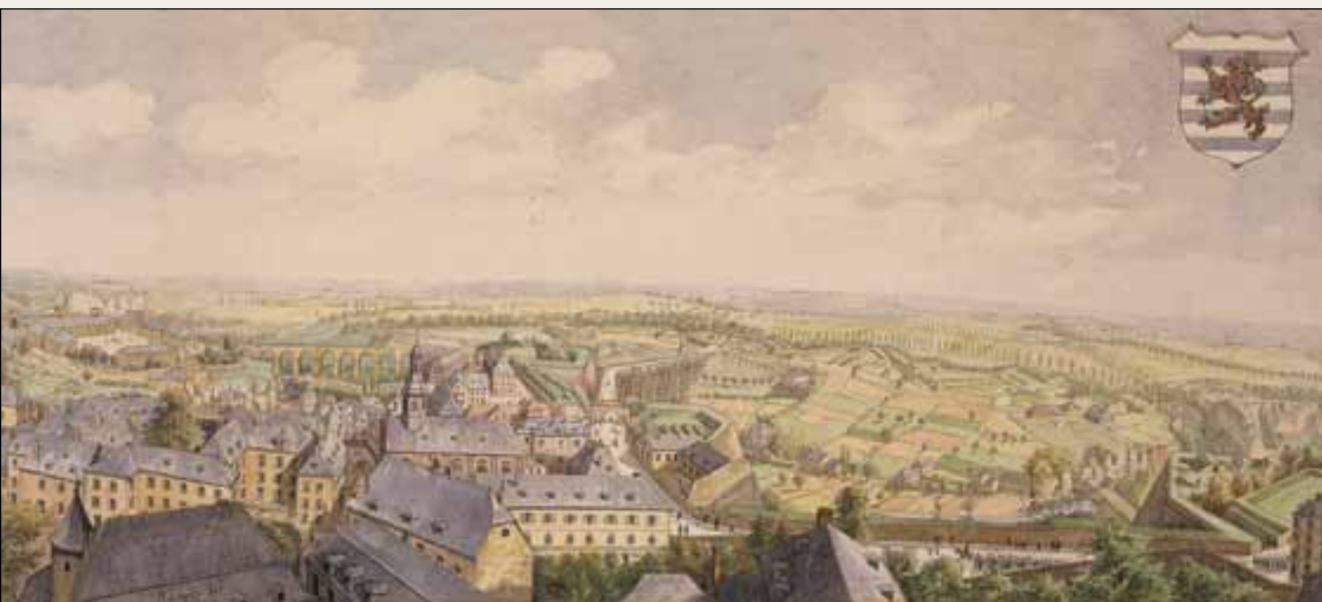
Vue sur la ville du haut de la tour de l'église Notre-Dame