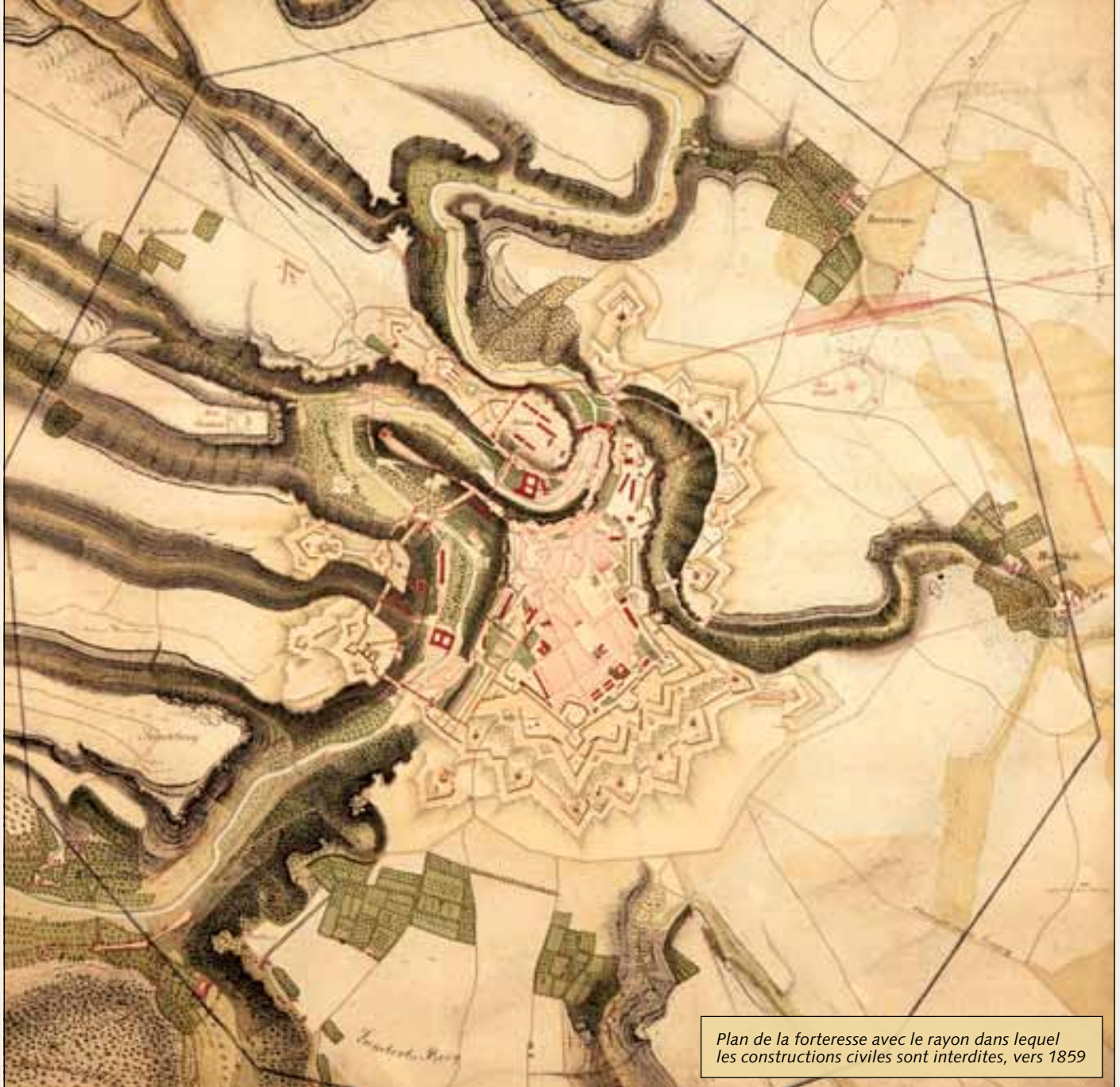
Plan de la forteresse avec le rayon dans lequel les constructions civiles sont interdites, vers 1859