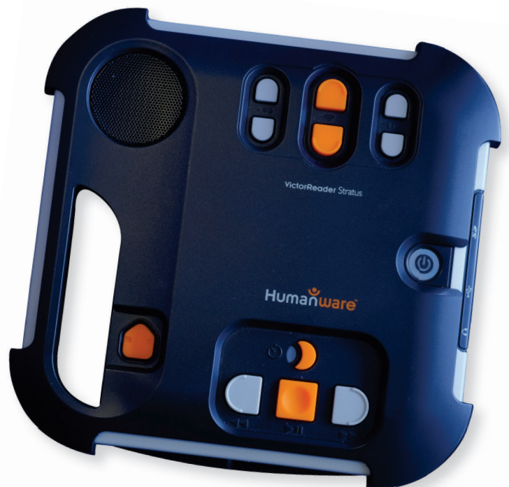
Der Victor Reader ist ein Abspielgerät für Hörbücher. Die deutlich fühlbare Markierung auf den Tasten ermöglicht sehbehinderten Menschen eine einfache Bedienung.