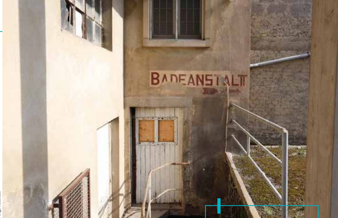
D'Iwwerreschter vun der "Badeanstalt" Voelker-Schumann.

1886 kënt et zur Grënnung vun der kommerzieller Wäscherei a Fierwerei Voelker-Schumann , där hir Gebailechkeeten nach haut ze gesi sinn (10, Vaubansstrooss). Si huet mat Quellewaasser an ouni Chimie gewäsch. D'Wäsch gouf beim Client ofgeholl an erëm zrëckgelievert. Duschen a Buedbidde goufen och do installéiert, well déi meescht Leit jo nach deemools keng Buedzëmmer haten. 1979 huet de Betrib opgehale.