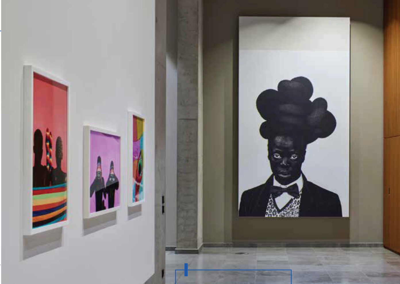
Vue de l'exposition "Of Beauty, Blackness & Power" (2019-20) chez Arendt&Medernach