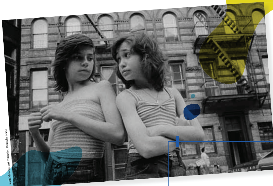
© Susan Meiselas, Art Collection Deutsche Börse