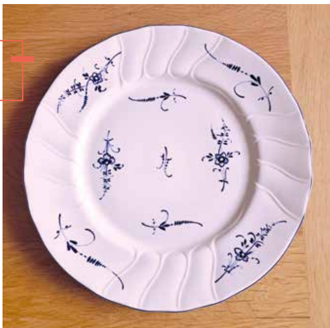
Teller Vieux Luxembourg

Am 30. Juni 2010 schließt das Traditionsunternehmen sein Werk in Siebenbrunnen, 230 Angestellte werden entlassen: Damit endet die 240-jährige Komplizenschaft zwischen dem Traditionsunternehmen und Luxemburg. Schmerzlich ist die Einstellung der Produktion auch für den damaligen Wirtschaftsminister, der vom Unternehmen die Rückzahlung der Staatsbeihilfen in Millionenhöhe einfordert. 13 Lediglich das Factory Outlet Center empfängt weiterhin Kundinnen und Kunden. Das Schloss Septfontaines , das zurzeit renoviert wird, soll Sitz der Luxembourg School of Business werden, derweil auf den Industriebrachen der renommierten Steingutfabrik ein großflächiges Immobilienprojekt mit Wohnungen, Geschäften, Gastronomiebetrieben, Büro- und Grünflächen entstehen wird. 14 Zu hoffen bleibt, dass Produkte aus dem Hause Villeroy & Boch dort die Erinnerung an die Saga der erfolgreichen Industriefamilie wachhalten. Zumindest bringt das Tafelservice Vieux Luxembourg den Namen jener Stadt auf die Tische zahlreicher Familien im In- und Ausland