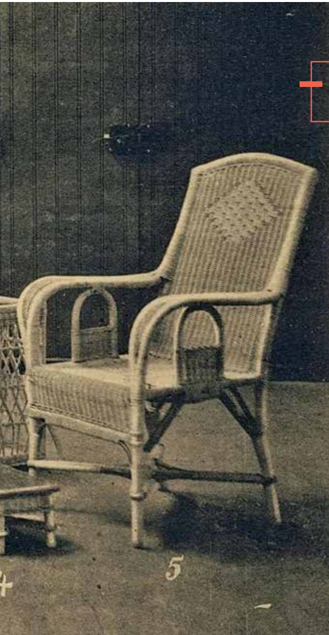
Gefängnisarbeit-Produkte aus den 1930er Jahren.

neraldirektor der Justiz, ein besonders leistungsfähiger Gefangener könne bis zu 50 Centimes pro Tag erhalten – bei einem Tagesertrag von etwa 1 Franc. In Frankreich lag der Anteil teilweise nur bei 14 Centimes.