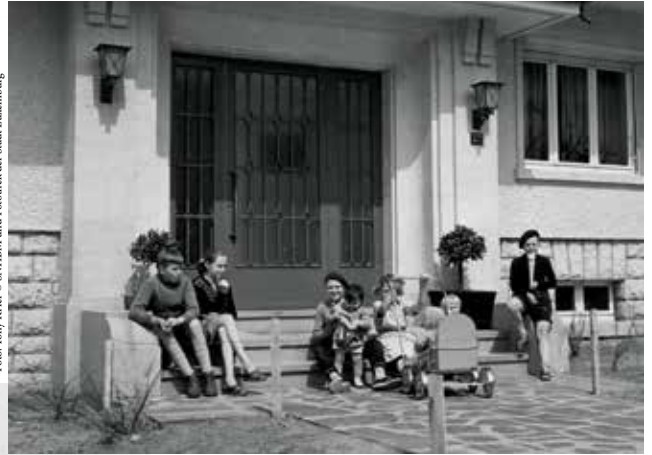
Mehrfamilienhäuser in der Cité Léon Metzler in Bonneweg.