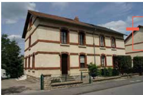
Ehemaliges Werkshaus in der rue Baudouin.

Einen genaueren Blick auf die Wohnverhältnisse in den Unterstädten Grund, Clausen und Pfaffen-thal richtete erstmals der ebenfalls 1906 von Aline Mayrisch mitbegründete Verein für die Interessen der Frau . Die Viertel an der Alzette waren traditionell durch industrielle Betriebe wie Gerbereien, Handschuhfabrik und Brauereien geprägt. Durch Missstände aufmerksam geworden, untersuchten die Frauen des Interessenvereins 258 Wohnungen und 90 Häuser der ärmeren Arbeiterbevölkerung mit der Methode der Sozial-Enquête. 2 Die Ergebnisse waren erschreckend. Dennoch sollte erst in den 1930er Jahren eine erste Sanierung der „Elendsviertel“ erfolgen.