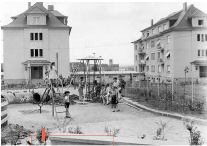
Spielplatz in der Cité Léon Metzler in Bonneweg.