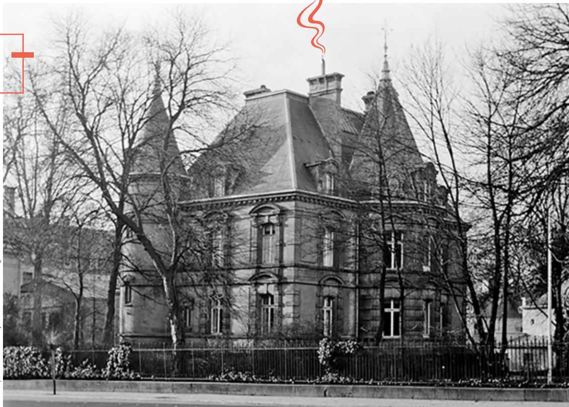
Villa Guillaume Bonaventure Pescatore