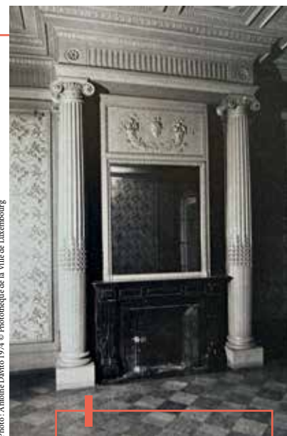
Photo: Antoine Davito 1974 © Photothèque de la Ville de Luxembourg