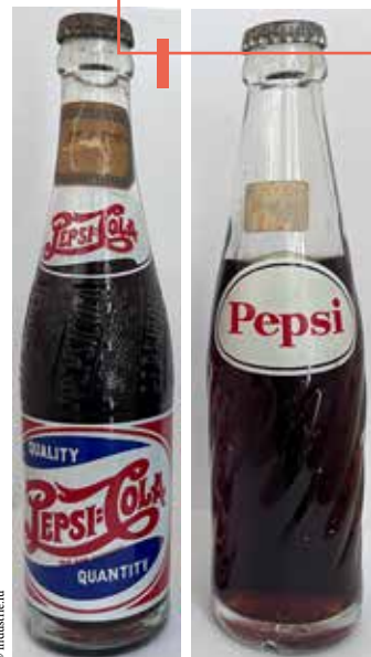
Zwou lëtzebuurger Pepsi-Fläschen (1949 an 1969)