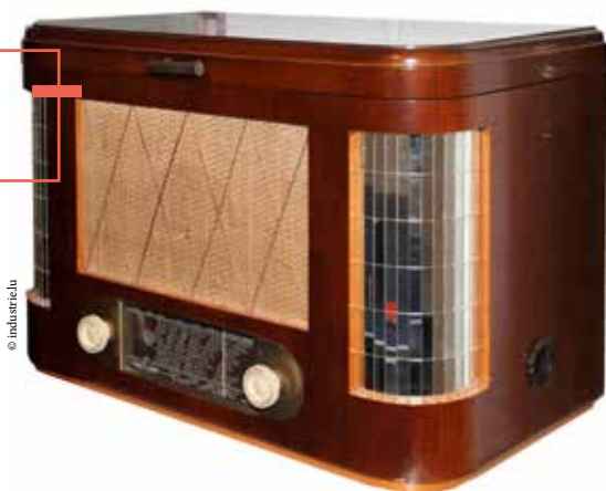
E Radio vun der Firma Ducal