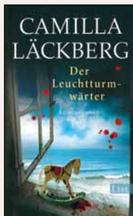
Läckberg, Camilla Der Leuchtturmwärter List, 476 S.