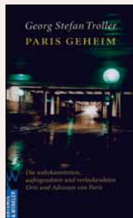
Troller, Georg Stefan Paris geheim Artemis-Winkler, 298 S.

Der Jude Richard Kornitzer, der die Nazizeit in Kuba überlebt, kommt 1948 in ein zerstörtes Deutschland zurück, an dessen Wiederaufbau er als Jurist mitarbeiten will. Die Demütigungen allerdings sind immens: Wiedergutmachungsforderungen werden ignoriert oder verschleppt, die auseinandergebrochene Familie findet nicht wieder zusammen. Immer größer werden Resignation und Verzweiflung. Und die Erkenntnis, allein zu sein mit den eigenen Erfahrungen, weicht der Aufbruchstimmung. Die fünfziger Jahre, die Zeit des Wiederaufbaus und des Wirtschaftswunders, sind gut beschrieben. Obwohl wenig emotionale Elemente im Buch enthalten sind, kommen beim Leser Emotionen hoch, und der Roman hinterlässt tiefe Eindrücke.