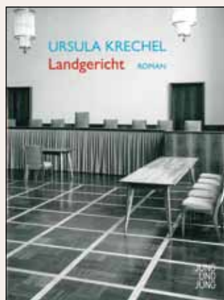
Krechel, Ursula Landgericht 494 S.

Bis zur unerwarteten Aufklärung der brutalen Tat bleibt die Geschichte so spannend, dass der Leser die fast 500 Seiten in kurzer Zeit verschlingen muss!