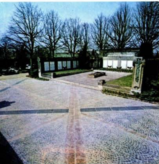
Afin de mieux pouvoir juger de l'effet produit, on a «essayé» un échantillon du futur dallage de la place Guillaume dans une allée du cimetière de Notre-Dame.