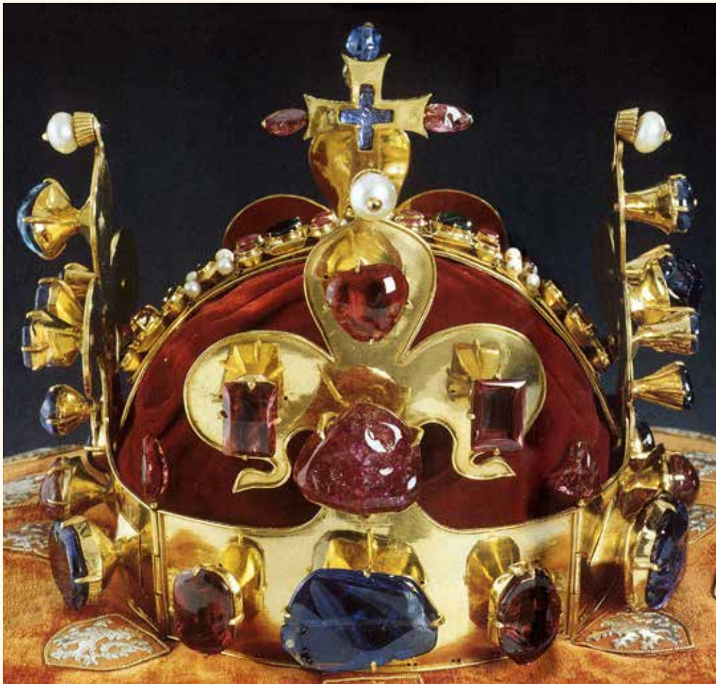
La couronne de Saint Venceslas, le 11 e Roi de Bohême. Charles IV la reçut pour son couronnement en 1347.

associé à une période de faste et de gloire pour les pays tchèques et pour leur capitale. Aujourd'hui encore, la ville porte de nombreuses traces de son règne: le célèbre Pont Charles, longtemps seul pont reliant les deux rives de la Vltava, le quartier de la Nouvelle-Ville et sa place Charles, et bien d'autres lieux et édifices encore.