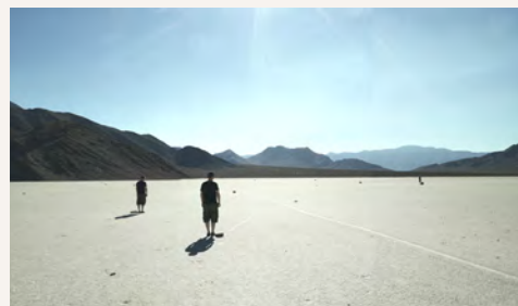
© David Brognon & Stéphanie Rollin