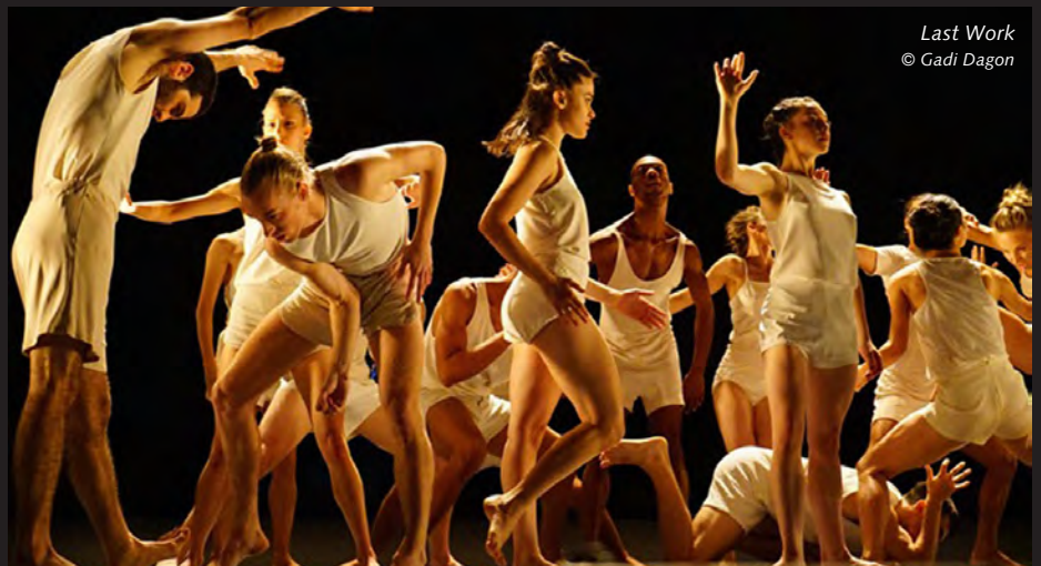
Last Work

La brisure des vases , eine Koproduktion der Luxemburger Theater und dem „zenmourballet“, ist eine Uraufführung. Die Nicolas Zenmour, ehemaliges Mitglied des