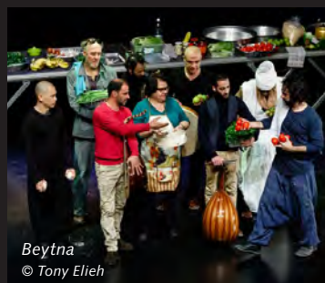
Beytna