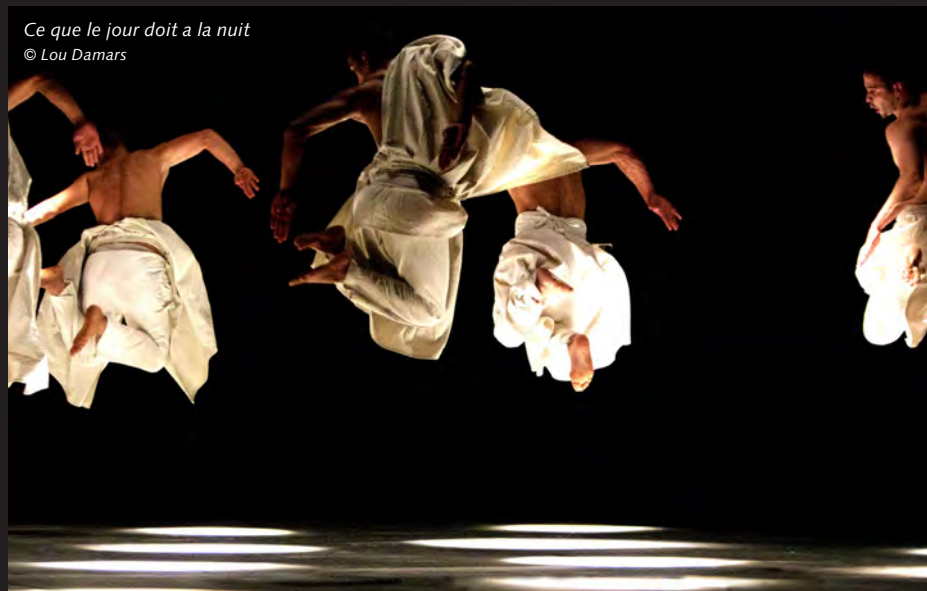
Ce que le jour doit à la nuit