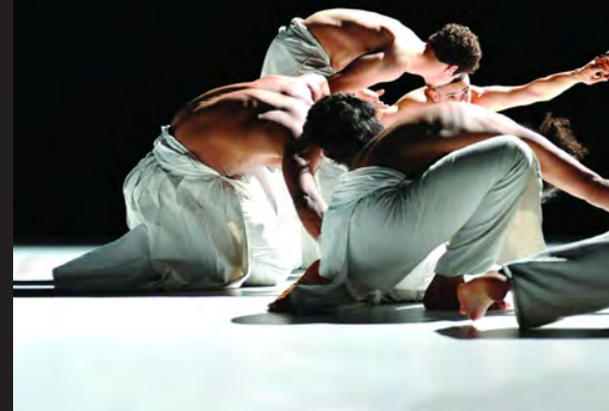
Ce que le jour doit à la nuit © Sylvain Marchou