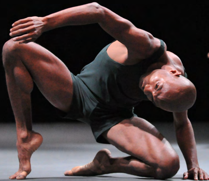
Last Work © Gadi Dagon