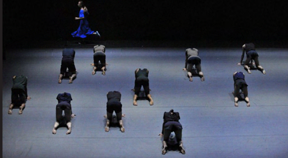
Last Work