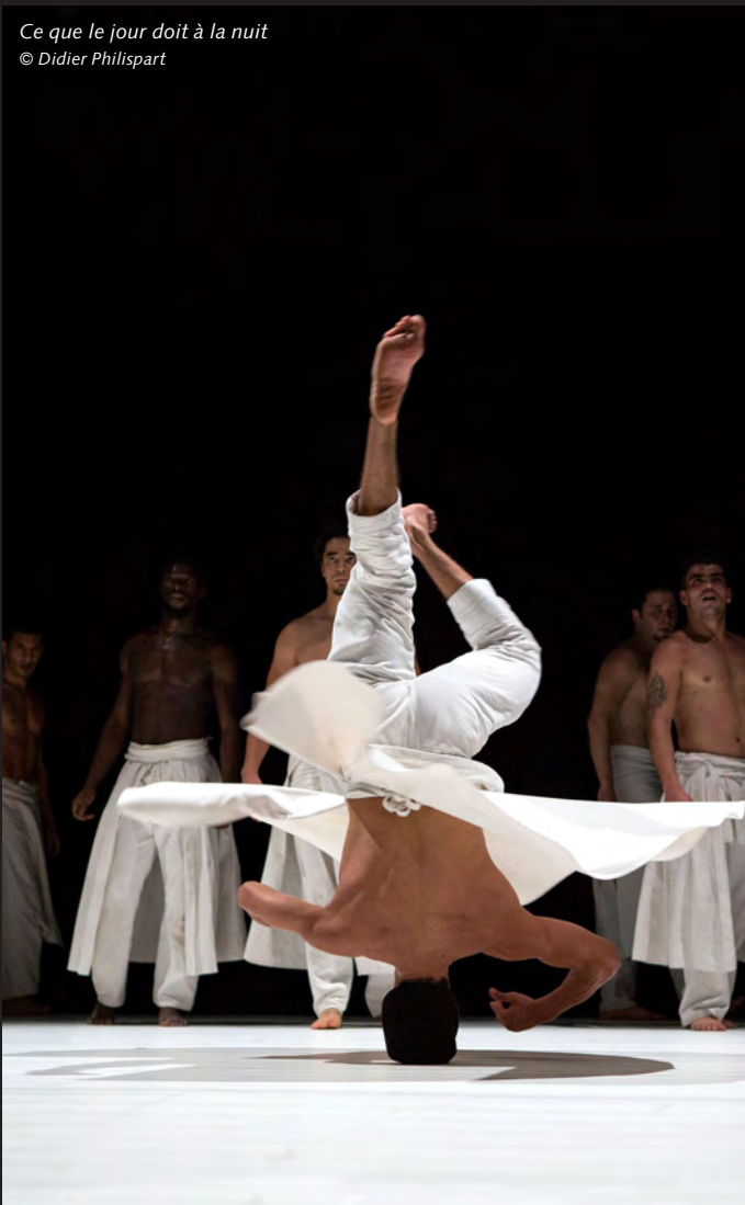
Ce que le jour doit à la nuit © Didier Philispart