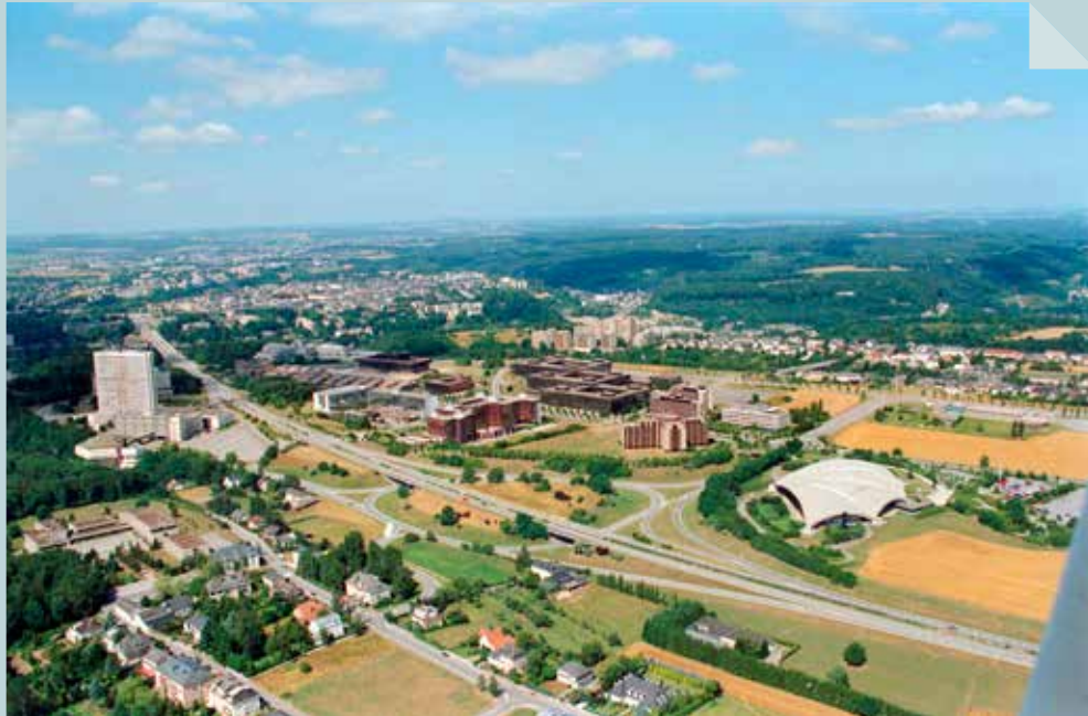
Carlo Hommel (1995) © Photothèque de la Ville de Luxembourg

Die Ansiedlung verschiedener europäischer Institutionen zog die Bebauung des Kirchbergs nach sich (s. auch Artikel von Colette Flesch in dieser Ausgabe). Auf dem Bild von 1995 gibt es noch viele landwirtschaftlich genutzte Flächen. Die erste Bauphase des Sportzentrums „Coque“ und, im Bild links davon, des Europäischen Gerichtshofes bestehen bereits. Ganz links erhebt sich das „Hochhaus“.