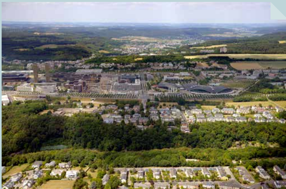
Rol Schleich (2014) © Photothèque de la Ville de Luxembourg

In nur 20 Jahren ist aus dem westlichen Teil des Kirchbergs aus grünen Wiesen und Feldern eine Stadt geworden, die durch die Gebäude der europäischen Institutionen geprägt ist. Die Bewohner von Weimershof, vorne im Bild, und Kirchberg, im hinteren Bereich, erleben eine nicht enden wollende Bautätigkeit im Osten der Hauptstadt.