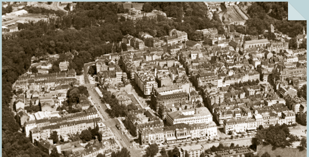
Théo Mey (1956) © Photothèque de la Ville de Luxembourg

Die beiden Fotos zeigen die Entwicklung des Boulevard Royal und des südlichen Teils des angrenzenden Limpertsbergs. Im Jahr 1956 ist die Innenstadt noch durch die Bebauung des ausgehenden 19. bzw. des frühen 20. Jahrhunderts geprägt. Die Brücke zum Kirchberg und das Stadttheater bestehen noch nicht.