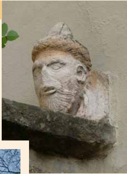
« Tête de Turc » (passage Schéieslach).