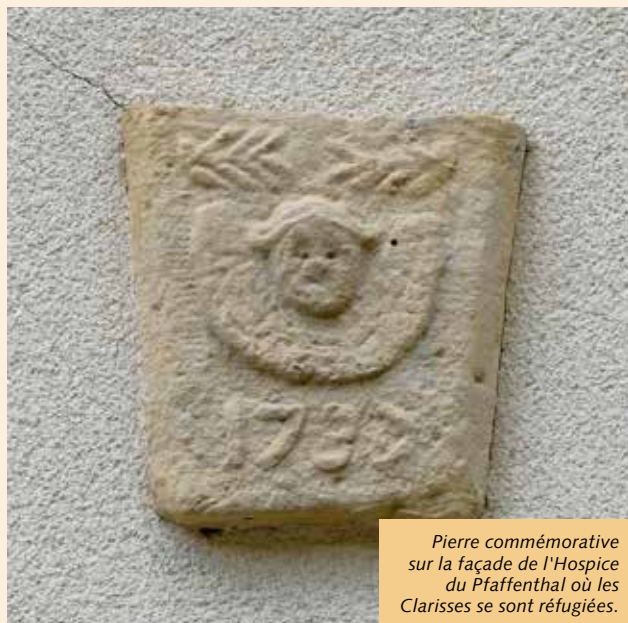
Pierre commémorative sur la façade de l'Hospice du Pfaffenthal où les Clarisses se sont réfugiées.