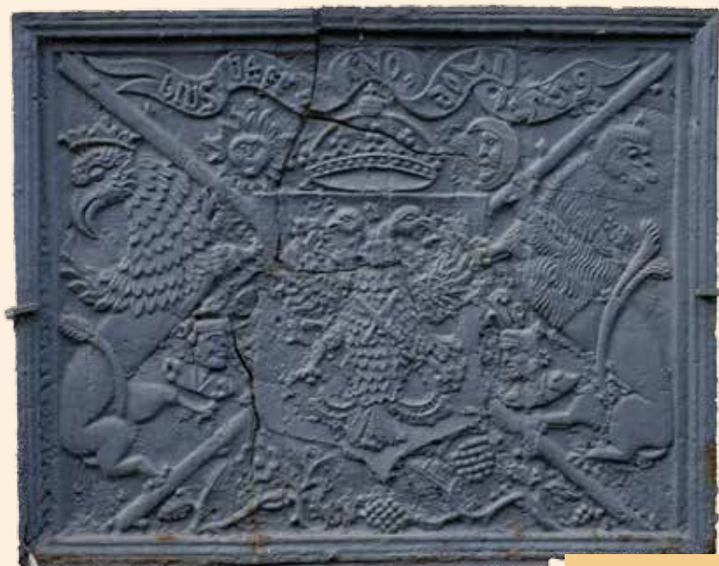
Taque représentant l'empire de Charles Quint partagé en 1555 (Breedewee).