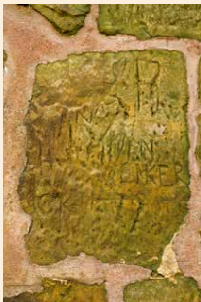
Signature des militaires prussiens (Fort Obergrünwald).