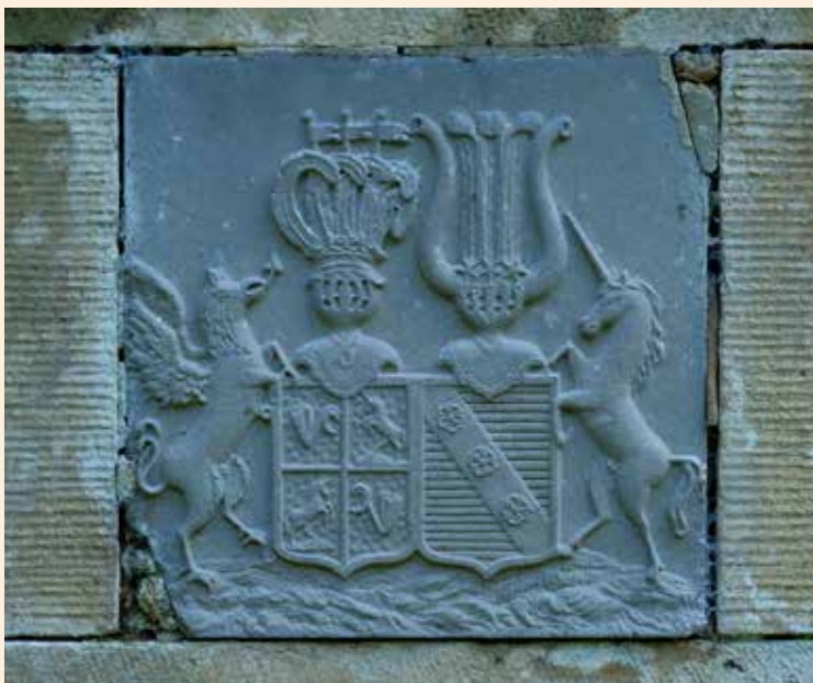
Cimetière prussien, taque Licorne, animaux imaginaires... « Fabelwesen ».