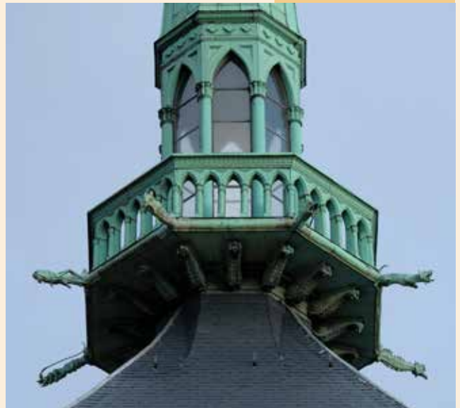
Gargouilles en forme d'animaux (Sauterelle, hippocampe, chien...) par Auguste Trémont vers 1935 (Tour Cathédrale).