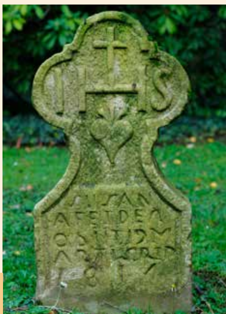
IHS (Iesus Hominum Salvator) Cimetière Prussien Clausen