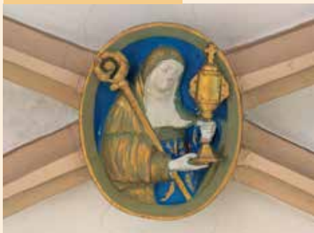
Clef de voûte représentant Ste Claire d'Assise, fondatrice de l'ordre des Clarisses.