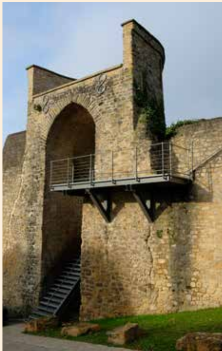
Marque de Tâcherons (Les tailleurs de pierres étaient payés à la tâche).