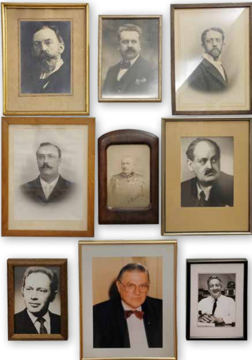
Portraits d'anciens frères accrochés aux murs de l'Hôtel de la Loge.

Le visiteur qui se promène dans l'Hôtel de la Loge remarque bien qu'aux étages il doit monter ou descendre plusieurs marches en passant d'une pièce à une autre. Mais à aucun moment il ne lui vient à l'esprit qu'il franchit le seuil d'une maison autre que le n° 5. En effet, la maison n° 7 rue de la Loge est ajoutée au patrimoine avant la II e Guerre Mondiale. ♦