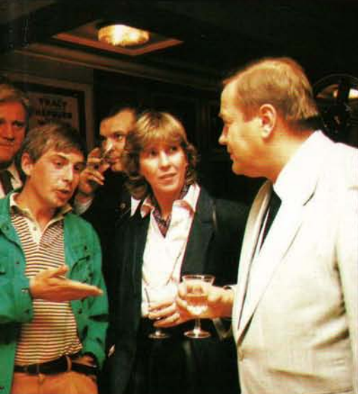
Le réalisateur portugais Manoel de Oliveira à la Cinémathèque à l'occasion du Panorama du Cinéma Portugais