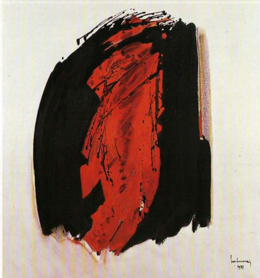
Le Passage des loups, 1985