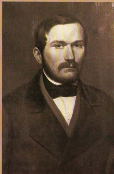
MERSCH-WITTENAUER Jean négociant et président de la chambre de commerce né à Luxembourg le 6 février 1819 décédé à Luxembourg le 25 novembre 1879 arrêté de nomination: 30 décembre 1869