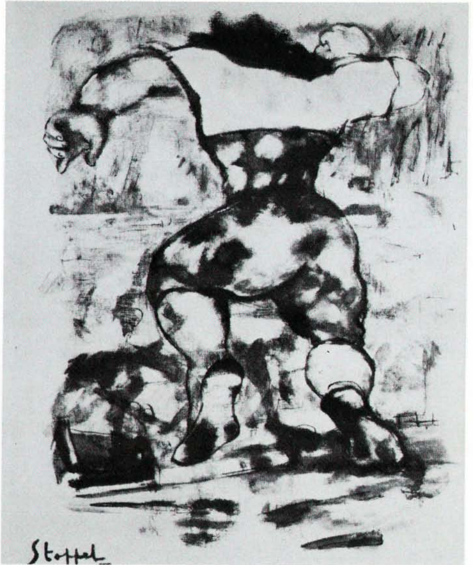
La Déchainée, 1942, toile

Des visites guidées ont lieu tous les jeudis et samedis à 15 heures. Sur demande d'autres visites guidées sont effectuées à l'intention des écoles et d'autres groupes. Prendre rendez-vous: téléphone 4796-2766. L'entrée est libre.