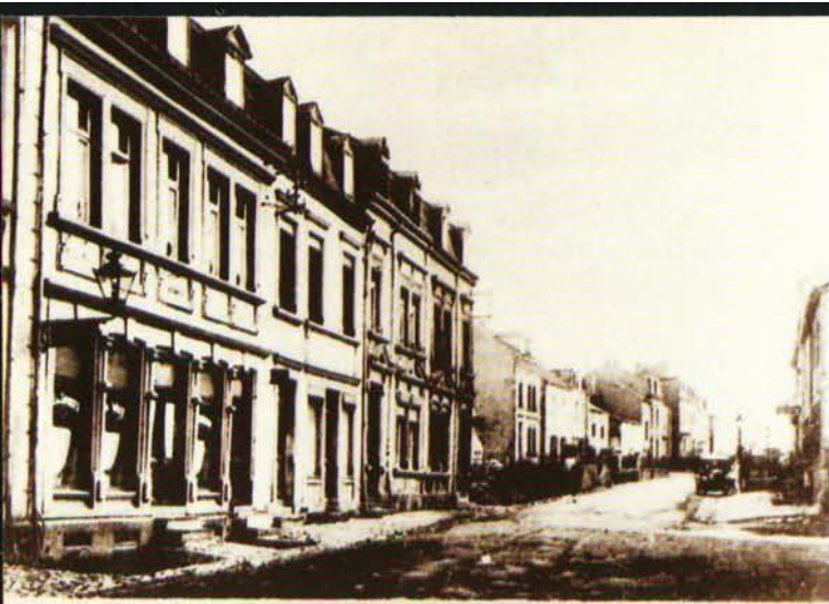
5 MÜHLENWEG - Rue du Moulin