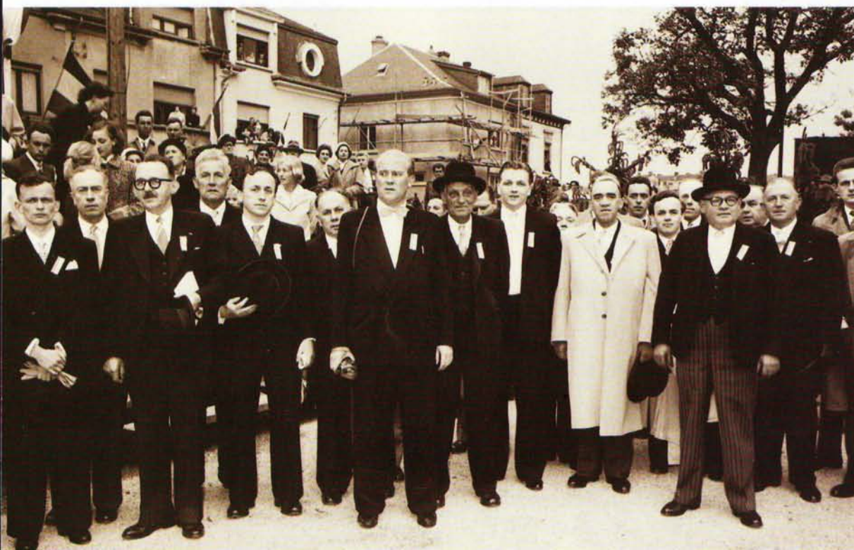
Einweihung des „Monument aux Morts“ am 10. Juni 1956