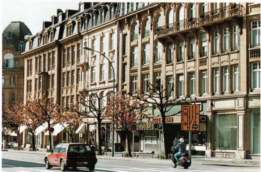
La place de Paris avant la fusion des communes en 1920; au milieu on reconnaît le petit bâtiment de l'octroi („Octroishaischen“)