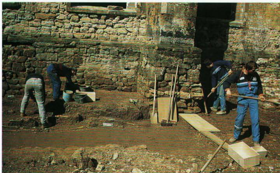
◀ Der Klostersgarten: Die erste gepflasterte Trierer Straße, die später der Vergrößerung des Friedhofs weichen mußte; links der ursprüngliche Friedhof, rechts die zweite Trierer Straße.