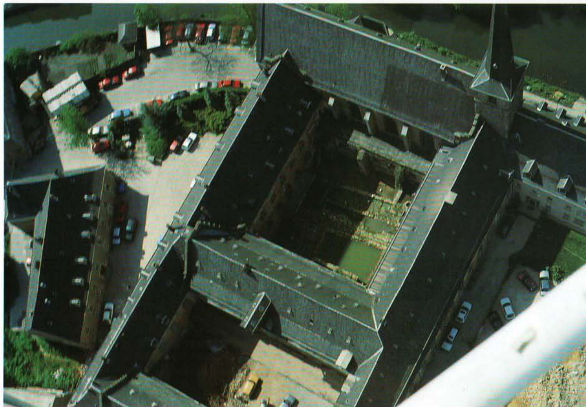
Der Klostersgarten vor dem Beginn der Ausgrabungen.