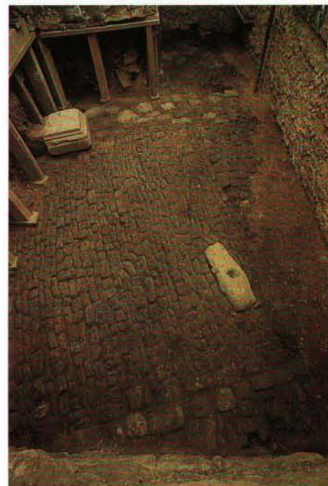
Die erste Neumünsterabtei: Die Pflastersteine des Eingangshofes, die vom heutigen Gebäude überschritten werden.

Auch verschiedene Krankheitsbilder lassen sich am Skelett ablesen: so z.B. die Syphilis, die Tuberkulose, einige Krebsarten, Knochenentzündungen, Skorbut, Mißbildungen an Gelenken, Blutergüsse und natürliche Knochenbrüche. Manche Menschen werden auch mit Mißbildungen geboren. Verschiedene Krankheitsbilder sagen auch viel über die jeweiligen Lebensumstände aus. Rachitis zum Beispiel geht auf einen Mangel an Vitamin D zurück, das dem Körper normalerweise durch eine gute Ernährung und durch Sonnenstrahlen zugeführt wird. Die