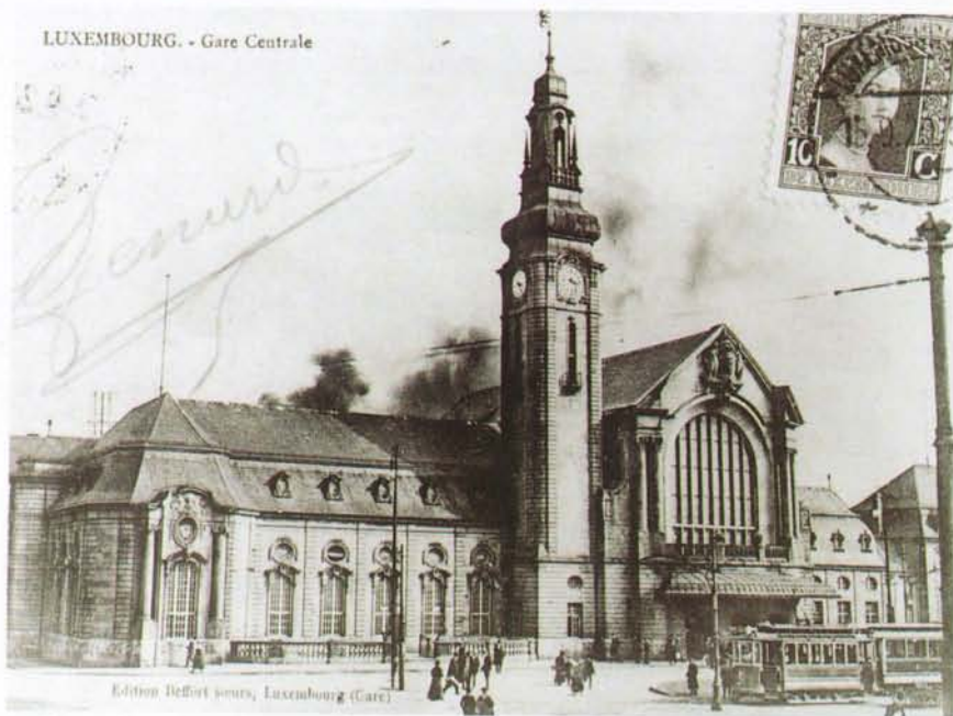
Postkartenedition der Druckerei Beffort (1920)

Pour tous renseignements, vous pouvez contacter le numéro 4796-2596