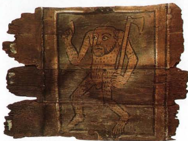
Metz Plafond peint „Homme sauvage“, 13 e siècle, bois polychrome Musées de la Cour d'Or, Metz

La suite du parcours montre les productions de la ville archéologiquement détectables: fibules, poteries, plombs à drap, patenôtres, tannerie et cordonnerie et autres carreaux de poêle. Les objets exposés dans la salle 3 documentent l'importance des échanges internationaux depuis la création d'une foire par Jean l'Aveugle en 1340. La diversité des origines des produits importés à cette occasion est étonnante: poterie en grès allemande, verrerie française, couteaux anglais et flamands, drap anglais, flamand, allemand et français. Les provenances diverses des monnaies et le grand nombre de poids de monnaie d'or témoignent de l'intensité de ces échanges.