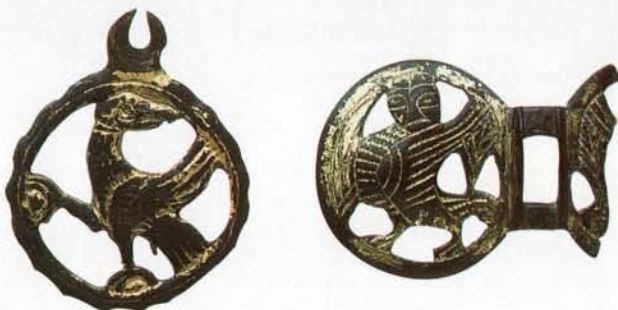
Trèves Pendentif de harnais de cheval et plaque décorative provenant de la bride du mors en bronze. Rheinisches Landesmuseum Trier

Les groupes sociaux en ville et les objets de la vie quotidienne prennent la relève dans les deux salles suivantes (5 et 6). Juifs, hommes d'église, pèlerins, bourgeois, bigots, enfants s'empressent à nous montrer leurs passe-temps favoris: collectionner de beaux livres enluminés, jouer aux échecs, se parer, se vêtir, boire et manger... La maison médiévale, en tant que cadre qui accueillait toutes ces activités, clôt notre parcours par un ensemble coloré d'éléments de décoration (salles 7-9): des fresques, une poutre héraldique, des boiseries peintes à la détrempe, une clé de voûte ou encore ce carrelage mis au jour lors des travaux de rénovation du palais grand-ducal.