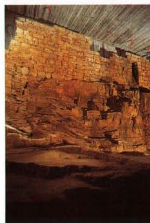
Luxembourg Dans la crypte archéologique aménagée Rue de la Reine on aperçoit les vestiges de la deuxième enceinte de la ville et du fossé creusé dans la roche datant de la fin du 12 e siècle