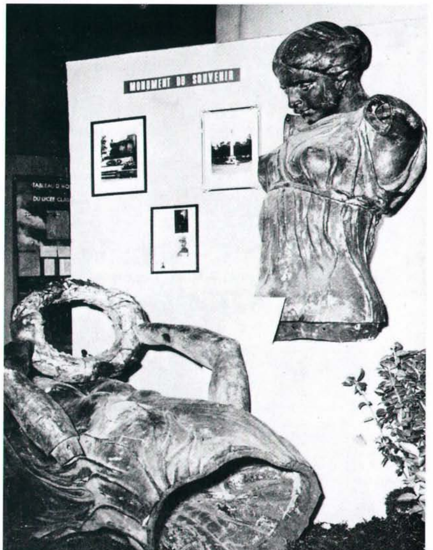
Bei der „Semaine de la Résistance“ waren d'Stécker vun der Gëlle Fra ewell 1955 an der Märei um Knuedler ausgestellt.

Deen anere Muerger as de Mann mat de Schlësele vum Stadion bleech gin; wéi ech mat engem Photograph opgekräizt sin an hien no der Gëlle Fra gefrot hun. Déi wir tabu, sot hien, et wir verbueden, fir se ze knipsen. De Knipsert an ech, mir hun äis bekuckt; da stëmmt et also, da läit se wiirlech do! 't war och sou, well no villem Biedelen a Fléiwen an ënnert der Konditioun, keng Photoen ze maachen, huet de Mann äis op d'Plaz gefouert. Mir hun äis missen elle bécken, mä ënnert den ënneschten Träppleken vun enger vun den Tribünen an hannert engem Koup Kuele louch d'Skulptur; an dräi Stécker, schéin opene getässelt, knaschteg an dach erëmz'erkennen; besonnesch den Deel mat Kapp, Äerm a Lorberkranz.