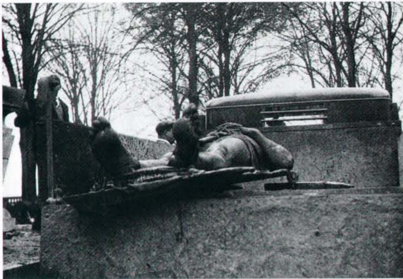
D'Figure vun der „Allegorie“ waren zu Hollerich am „Salzhaff“ fond gin ...