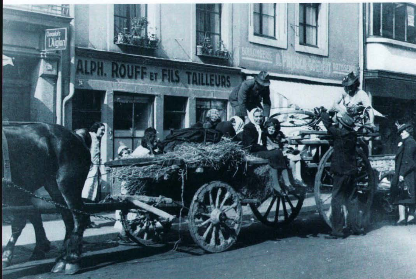
Mai 1940, rue Notre-Dame: Evacués!

Serge Hoffmann: Les relations germano-luxembourgeoises à la veille de la seconde guerre mondiale et leur incidence sur les festivités du Centenaire de 1939. In: Galerie 7 (1989) no 1, pp. 77-88.