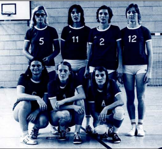
Die CAL - Damen am 8. Dezember 1973