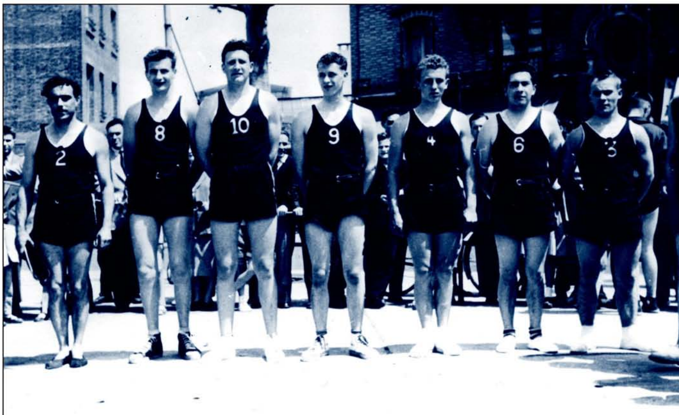
Die Herrenriege des Bonneweger Turnvereins in den Nachkriegsjahren