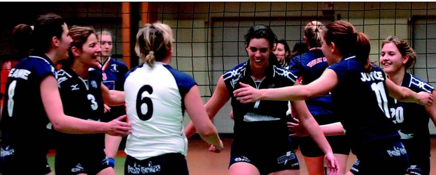
Die Damenmannschaft des VC Olympic, 1984