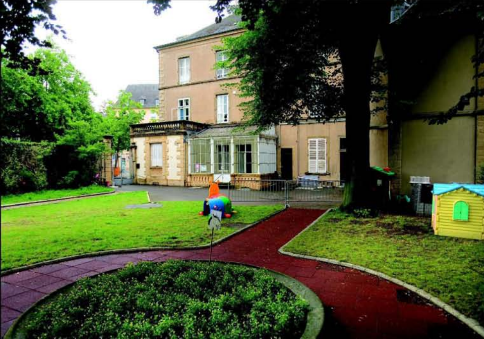
Innerstädtische Oase: der Garten des Vereinshauses heute - links die Mauer des Kreuzganges vom Franziskanerkloster