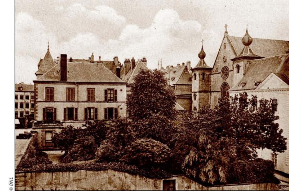
Der Garten des Vereinshauses im Jahr 1921

Eine weitere Teilung der Parzellen findet 1904 statt, als die Banque Internationale den nördlichen Teil ihrer Grundstücke an die Familie Lassner-Simonis verkauft, und selbst ihren Firmensitz verlegt. Nachdem die Firma Lassner ihren Teil des Gebäudes für ihre Bedürfnisse umgebaut hat, eröffnen im Jahr 1906 die Elisabeth-Schwester im ehemaligen Sitz der Internationalen Bank ihr als Vereinshaus bekannt gewordenes Mädchenheim. Es ist für den Verein der vom Lande kommenden und in der Stadt