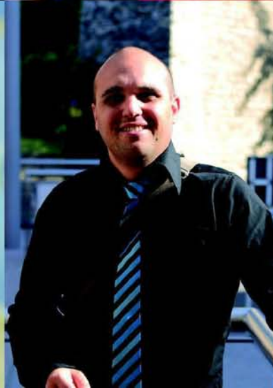
Portraits d'aventuriers photographés au Pfaffenthal par Guy Hoffmann