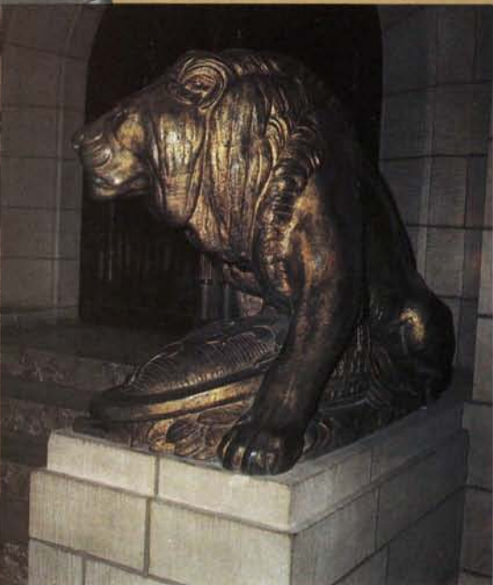
Porte Mansfeld Crypte Cathédrale