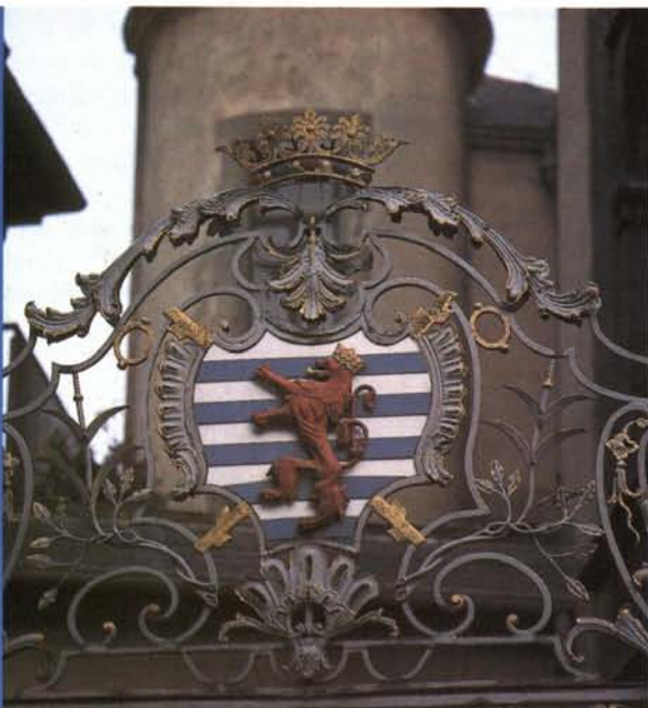
Monument Dicks et Lentz Palais Grand-Ducal