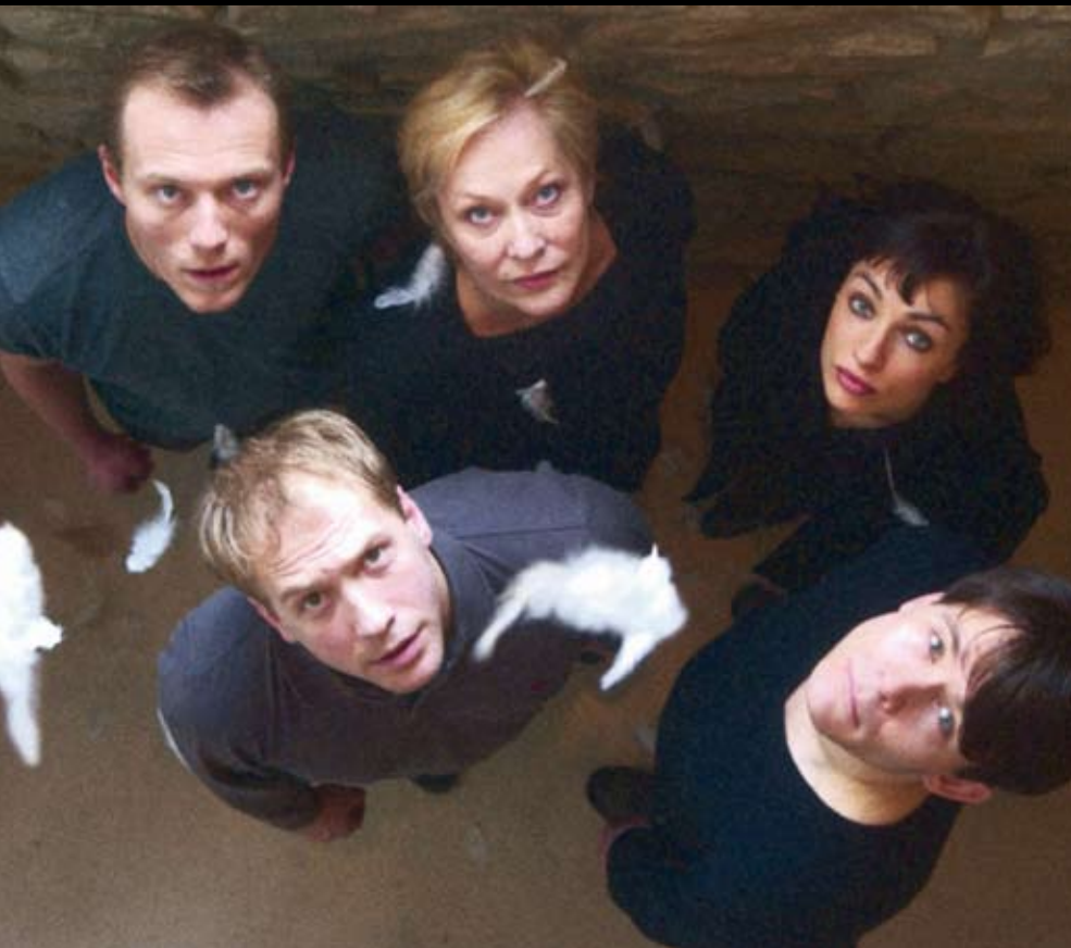
Angels in America