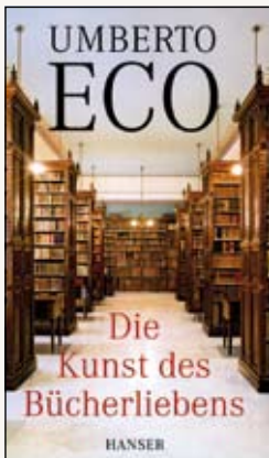
ECO, Umberto Die Kunst des Bücherliebens Hanser, 2009

Es ist bekannt, dass Umberto Eco ein großer Bücherliebhaber und Büchersammler ist. Also einer von jenen glücklichen Menschen, die die Bücher nicht nur ihres Inhalts wegen schätzen, sondern auch wegen ihrer Form, ihres Alters, ihrem Einband oder ihrer Seltenheit.