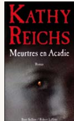
REICHS, Kathy Meurtres en Acadie Robert Laffont, Paris, 2009

Khaled Hosseini versteht es wunderbar, die Befindlichkeiten der zwei Jungs mit subtilen Worten eindrücklich zu beschreiben, die Traditionen lebendig werden zu lassen und zugleich die brutale Ungeheuerlichkeit der politischen Geschehnisse darzustellen.