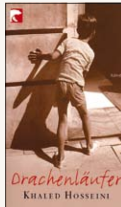
HOSSEINI, Kaled Drachenläufer Berliner Taschenbuch Verlag, 2008