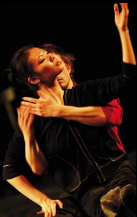
La compagnie d'Akram Khan

Anne Teresa de Keersmaecker a elle aussi eu recours à la collaboration d'artistes plasticiens pour The Song créé en 2009: le sculpteur et photographe Michel François et l'artiste de la lumière Ann Veronica Jannsens. Ce spectacle, présenté à Luxembourg début mars, est qualifiée par La Libre Belgique de «retour aux sources de la danse».