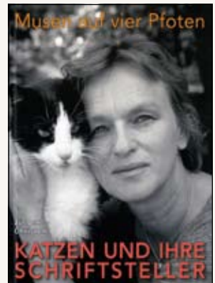
CHRISTEN, Jürgen Katzen und ihre Schriftsteller Autorenhausverlag, 126 S.

Bien-sûr il faut avoir beaucoup d'amour pour les chats afin d'être capable d'accepter toutes les bêtises et détériorations en tous genres que ces sympathiques félinés peuvent occasionner. Cependant, Birmingham, appelé généralement Brum, semble de loin dépasser ces congénères en ce qui concerne le nombre de gaffes à réaliser pendant une vie de chat. Il faut savoir que le journal de Monsieur Chatastrophe est déjà le deuxième ouvrage que l'auteur consacre à son fidèle compagnon Brum. Car Brum n'est pas un chat comme les autres, il ne sait pas chasser, il adore nager dans la pataugeoire de Maya, la fille de l'auteur et il ne voit les vitres, de sorte qu'il a déjà cassé une fenêtre en fonçant à toute allure vers son maître. Malgré tous ces désastres, Brum a atteint l'âge honorable de 14 ans, et, même mort, il reste en contact avec son maître.