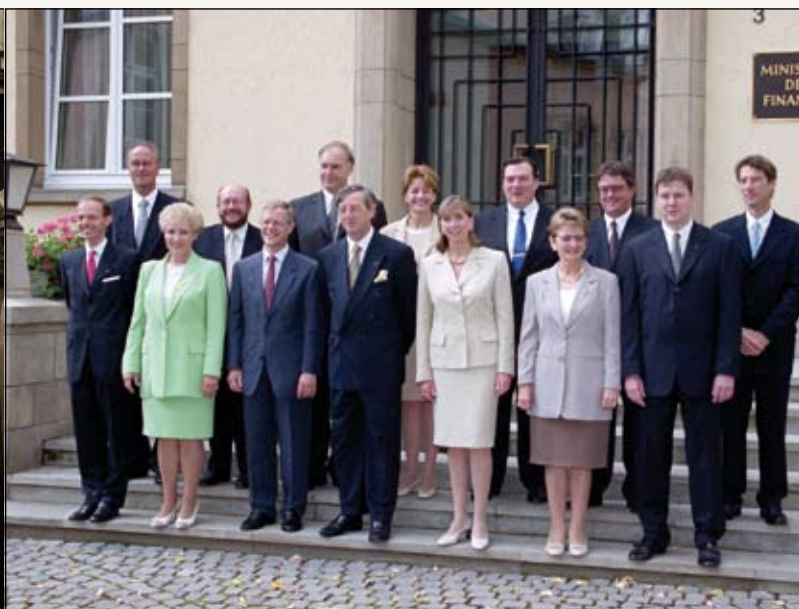
1999: Vereidigung als Erziehungsministerin