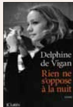
Vigan, Delphine de Rien ne s'oppose à la nuit Lattès, 436 p.

Une loi française de 1854 décida d'envoyer dans les bagnes coloniaux de Guyane tout condamné aux travaux forcés. Cette loi, qui permettait à la France de se débarrasser, en toute légalité, de petits voleurs et autres délinquants, prévoyait également l'envoi dans ces contrées lointaines de jeunes femmes pauvres et coupables de délits mineurs afin d'être mariées à des bagnards et d'assurer ainsi le peuplement de la colonie. C'est l'histoire de Marie, une jeune femme coupable de quelques vols à l'étalage, qui arrive en Guyane après une traversée horrible dans la cale nauséabonde d'un bateau. Marie, tout comme les autres femmes partageant le même sort, espère que tout ira mieux une fois installée à Saint-Laurent-du-Maroni en Guyane. Or, le sort qui attend les jeunes femmes est loin de leurs espoirs. Elles doivent vivre dans un sordide carbet, une sorte de hangar de bois et de tôles insalubre, sous le contrôle d'une religieuse. Au fil du temps, les jeunes femmes décèdent les unes après les autres et la seule survivante est Marie. Ainsi, elle est toujours en vie lorsque le journaliste Albert Londres se rend en Guyane afin d'écrire sur les hommes du bague de Cayenne, or, le sort des quelque deux mille femmes, également envoyées au bague, n'est mentionné nulle part.