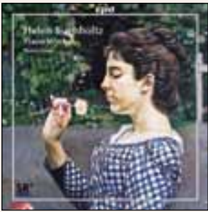
Buchholtz, Helen: Klavierwerke CPO, 2011 1 CD (etwa 56 Min.) Interpret: Marco Kraus