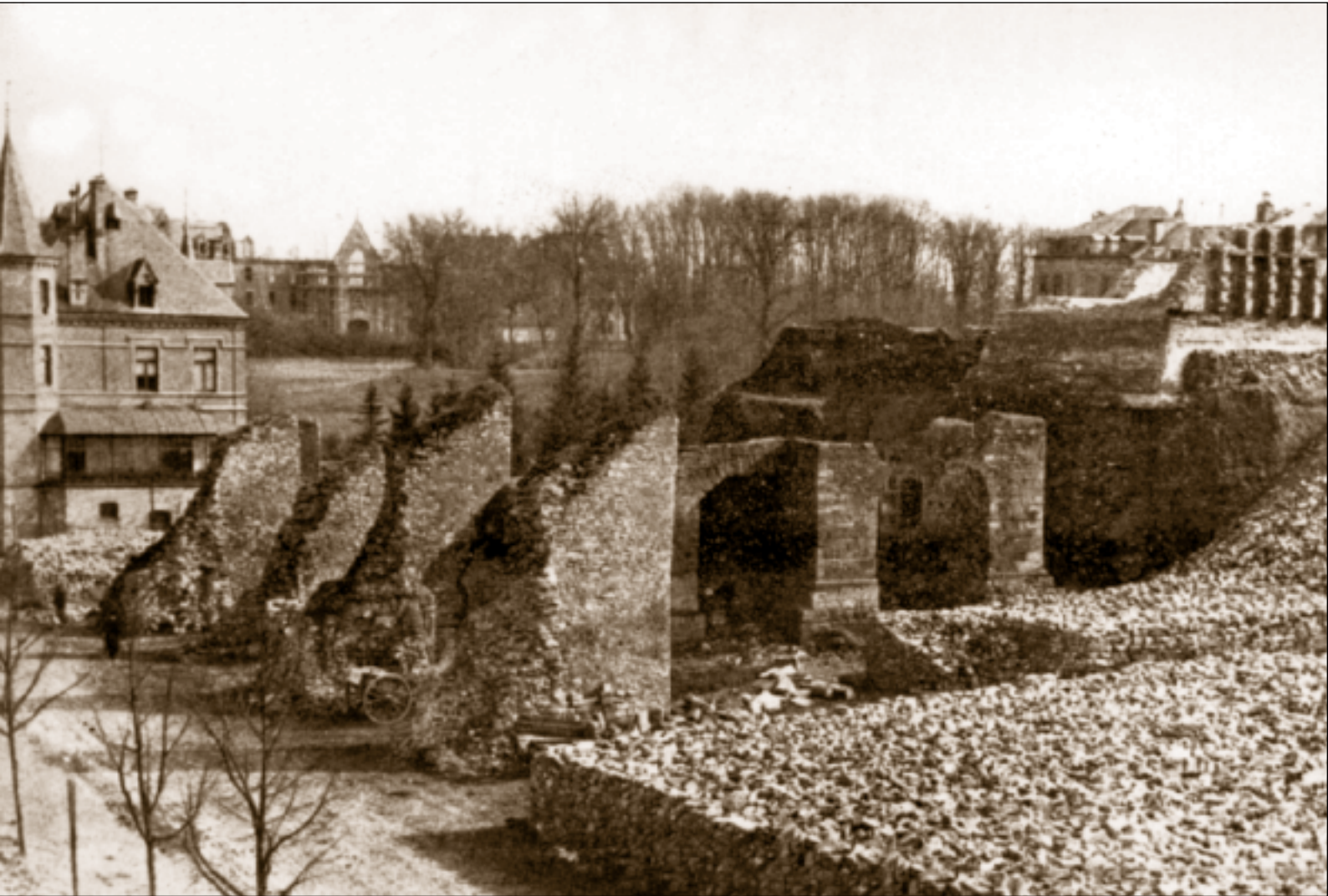
Die Schleifung des Bastion Berlaymont (1890)