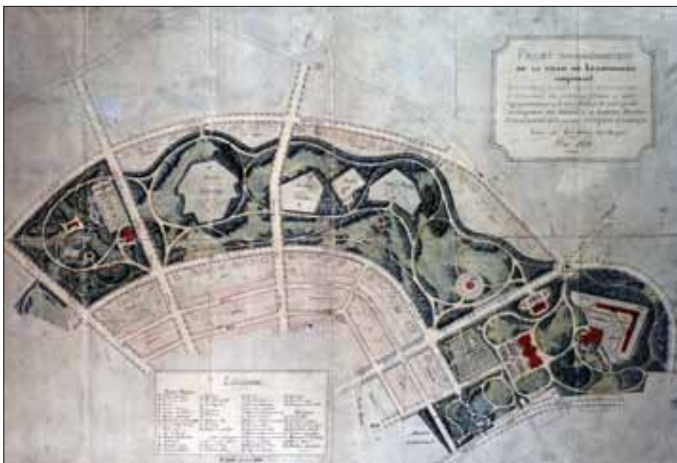
Stadtbebauungsplan von Edouard André (1871)