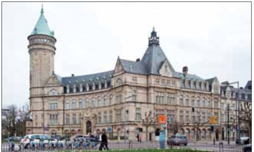
Prunkbauten der Avenue de la Liberté: Die Direktionsgebäude der Luxemburger Sparkasse (links) und der Arbed (rechts)

im Süden des Landes entwickeln sich die Vorstädte Hollerich und Eich in schnellem Rhythmus. Der Vorrat an Immobilien auf den Festungsbrachen ist nahezu aufgebraucht. Neues Bauland für Villen wird rund um den neu angelegten Boulevard Joseph II geschaffen. Für die Bedürfnisse des Mittelstandes werden die Seitenstraßen zur Avenue de la Gare angelegt. Das Bastion Berlaymont wird ab 1890 für den Bau von bürgerlichen Einfamilienhäusern freigegeben. Die Stadt Luxemburg beauftragt den Städteplaner Josef Stübber mit der Erstellung eines Bebauungsplanes für Limpertsberg, denn die Trambahn führt bis zum Glacis. Periphere Lagen können somit schneller erschlossen werden. Das Angebot reicht nun über die ehemaligen Festungsbrachen hinaus. Der Wert dieser peripher gelegenen Grundstücke liegt im Vergleich zu den zentralen Lagen bei einem Viertel deren Verkaufspreises.