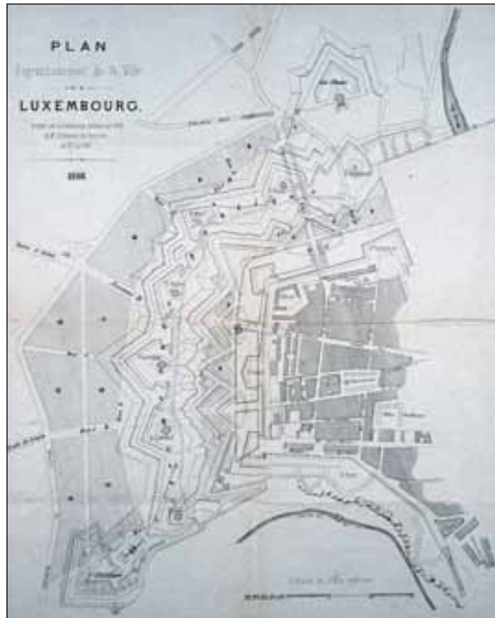
Stadtbebauungsplan von 1868

Im Zeitalter der Pferdetrambahn (ab 1875) hatte man es verstanden, dass sich der Markt „Stadt“ dank einer gut durch-